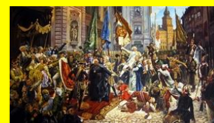
Konstytucja 3 Maja