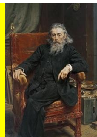
Autoportret 1892 olej na płótnie w zbiorach Muzeum Narodowego w Warszawie

Apart from monumental historical paintings, Matejko created portraits. He painted both his relatives, as well as personalities from his contemporary elite. One of his last works was a series of portraits "The collection of Polish kings and princes", which remained in the minds of Poles for good as images of the past rulers. At the end of his life, Matejko also painted his self-portrait, which is considered to be one of his the most outstanding paintings.