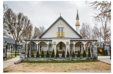
Meczet w Białymstoku