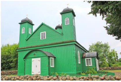
Meczet w Kruszynianach

The best information tabloid of natural and nature heritage since 2021 Najlepszy tabloid informacyjny o dziedzictwie kulturowym i przyrodniczym od 2021 roku