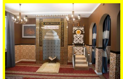
Wnętrze meczetu w Białymstoku

Reporter Jadwiga Barcewicz March 12, 2021