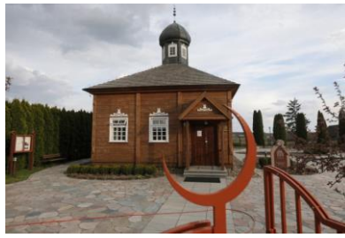
Meczet w Bohonikach