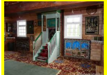
Wnętrze meczetu w Bohonikach