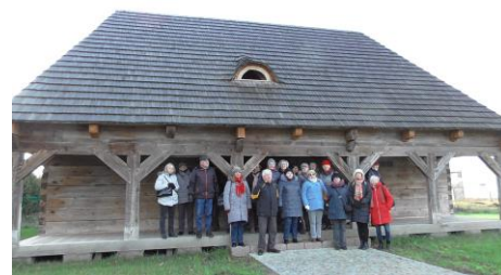
CHEST project participants visit the Lamus in Knyszyn