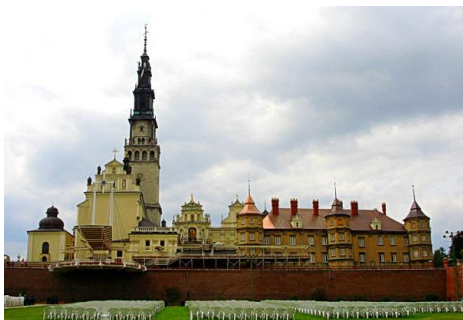
Klasztor na Jasnej Górze

The best information tabloid of cultural and nature heritage since 2021 Najlepszy tabloid informacyjny o dziedzictwie kulturowym i przyrodniczym od 2021 roku