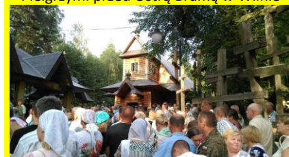
Pielgrzymi na św. Górze Grabarce