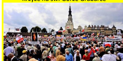
Pielgrzymi na Jasnej Górze w Częstochowie

In August, the Orthodox pilgrimage for the Feast of the Transfiguration on the Holy Mountain of Grabarka also sets out. Celebrations are held every year on August 17-18. The route is 90 km long. This sanctuary is famous for: the miraculous Iwierska Icon of the Mother of God, a healing spring and votive crosses brought by pilgrims and left on the hill. There are already over 10,000 of them.