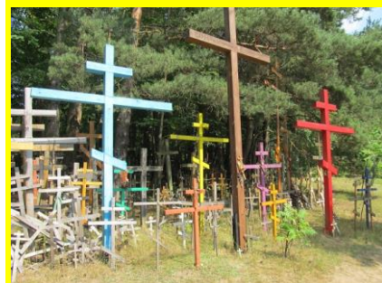
Krzyże na św. Górze Grabarce