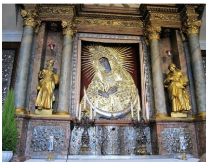
Matka Boska Ostrobramska