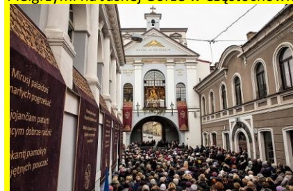
Pielgrzymi przed Ostrą Bramą w Wilnie